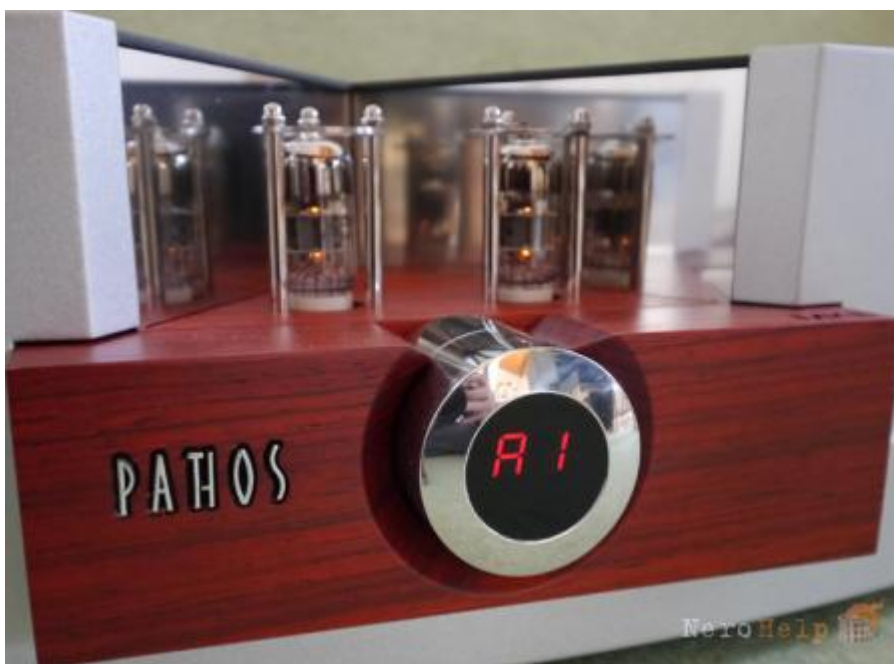
Пара ламп ECC83 работает в предусилительном каскаде

Качество изготовления и отделки Logos впечатляет. Нам нравится внимание к деталям, например вырезанная на деревянной панели надпись «Mk II» и круглые отверстия с решетками - на верхней. Кому-то это может казаться чересчур нарочитым, но сделано все весьма стильно.